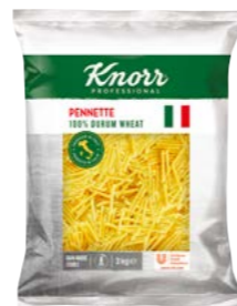
Pennette 3 kg