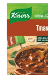
Hotová jíška tmavá 0,25 kg