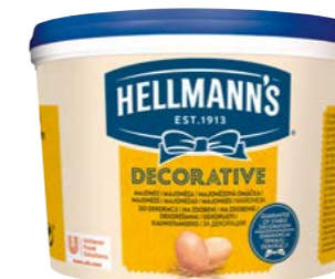
Decorative majonéza 3 l