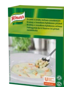
Krutony s česnekovo-bylinkovou příchutí 700 g