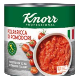
Polparicca di Pomodoro krájená rajčata 2,55 kg