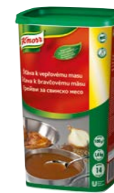
Šťáva k vepřovému masu 1,4 kg Vydatnost: 14 l