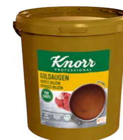
Goldaugen – Hovězí bujón 20 kg Počet porcí: 3 332