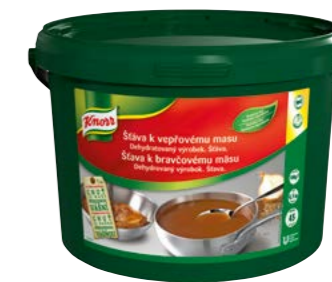
Šťáva k vepřovému masu 4,5 kg Vydatnost: 45 l