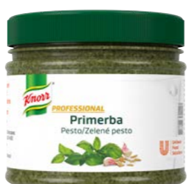
PRIMERBA Zelené pesto 340 g