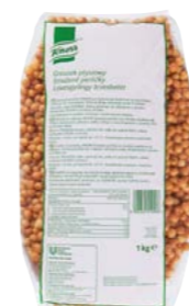
Smažené perličky 1 kg

Skvěle chutnají a na talíři vypadají tak lákavě. Vložky do polévek Knorr jsou zkrátka pohodový doplněk, který se hodí nejen do vašich krémových polévek.