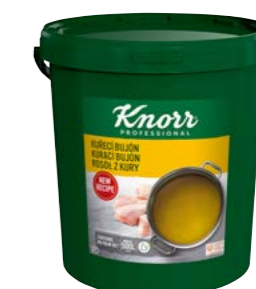
Kuřecí bujón 10 kg Počet porcí: 2 000