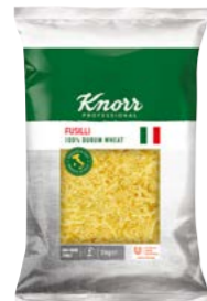
Fusilli 3 kg