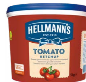
Kečup 5 kg

Kečupy s příjemně sladkokyselou chutí se hodí k celé řadě pokrmů. Díky speciálnímu porcovanému balení a unikátnímu systému dávkování je zaručen vysoký stupeň hygieny.