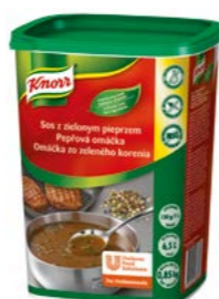
Pepřová omáčka 0,85 kg