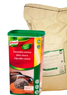
Tmavá jíška 1 kg/10 kg