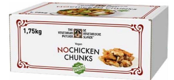
NoChicken Chunks 1,75 kg