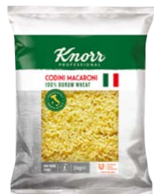
Codini – Kolínka 3 kg