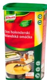
Holandská omáčka 1 kg