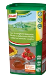
Základ pro boloňskou omáčku 1 kg

S prémiovými italskými omáčkami Knorr vykouzlíte pravou Itálii během chvilky. Perfektní ke všem druhům těstovin, na gnocchi, tortellini i ravioly, k drůbežimu a telecímu i všem mletým masům.