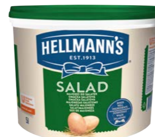
Salad 5 l

Jemné, z kvalitních ingrediencí a s nezaměnitelnou chutí Hellmann's – přesně takové jsou naše majonézy. To pravé pro přípravu dipů, studených omáček, salátů nebo obložených vajec.