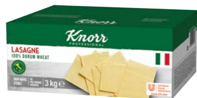
Lasagne 3 kg