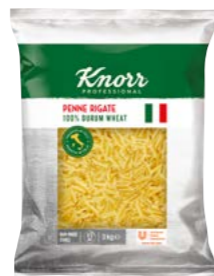
Penne 3 kg