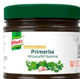
PRIMERBA All Italiana 340 g