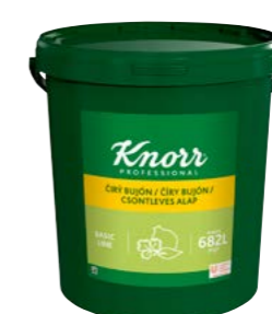
Čirý bujón 15 kg