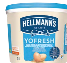
Yofresh 5 l