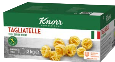
Tagliatelle 3 kg