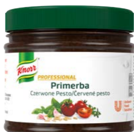
PRIMERBA Červené pesto 340 g