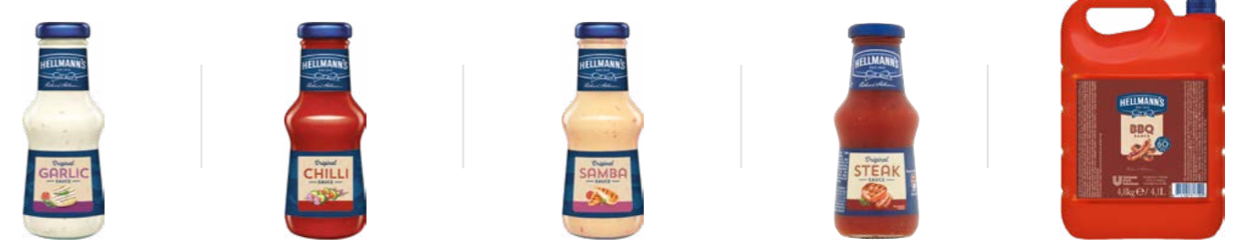
Omáčka k masu Česneková 250 ml Omáčka k masu Chilli 250 ml Omáčka k masu Samba 250 ml Omáčka k masu Steak 250 ml Barbecue omáčka 4,8 kg

Jedinečná kombinace chutí, která perfektně doplní grilované maso a další dobrotu z grilu. Stačí vybrat tu pravou Hellmann's omáčku k masu a je to!