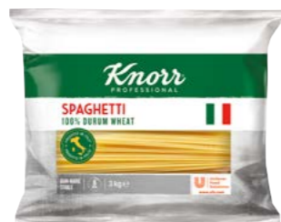
Spaghetti 3 kg