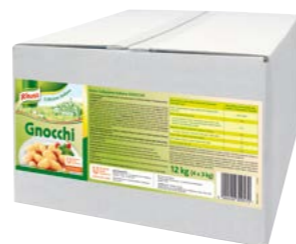
Gnocchi 12 kg