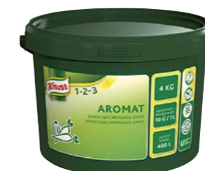
Aromat 4 kg