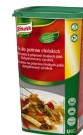
Fix pro čínská jídla 1 kg