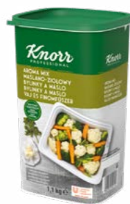
Aroma Mix Bylinky & Máslo 1,1 kg

Když potřebujete dochutit těstovinová, rýžová či zeleninová jídla a dodat jim něco navíc. Pokrmy pak během uchování v ohřevných nádobách neztrácejí svou vlhkost, chuť ani vůni.