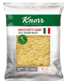
Gnocchetti Sardi – Mušličky 3 kg