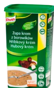
Hříbkový krém 1,3 kg

Z nabídky našich trendy zahuštěných polévek si určitě vybere každý, kdo chce svým zákazníkům na talíři servírovat vždy jen to nejlepší.