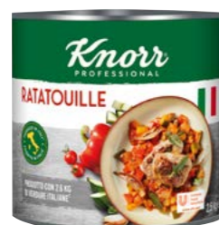
Ratatouille 2,5 kg