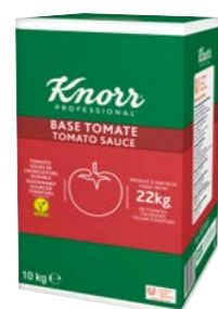
Rajčatová omáčka 10 kg

Vyrobená v Itálii z 22 kg rajčat, které zrálí na slunci. Rajčata jsou udržitelně pěstovaná. Obsahuje pouze rajčata a mořskou sůl.