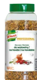
Sypký kořenící přípravek na hovězí 0,75 kg

Hrubozrnná struktura umožňuje marinování masa na sucho i klasickou cestou. Vhodné nejen pro úpravu masa, ale i zeleniny či brambor, při grilování, rožnění, pečení a přípravě v konvektomatu.