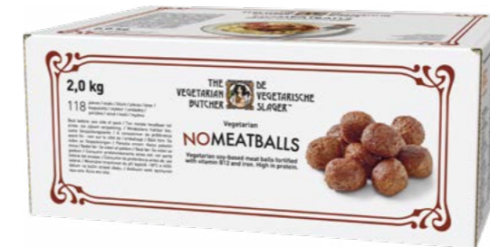
NoMeatballs 2 kg (111 x 17 g)

Plné chuti a na rostlinné bázi. Pro milovníky masa od milovníků masa.