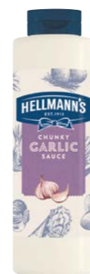
Česneková omáčka 860 g