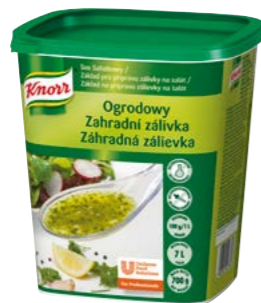
Zahradní zálivka 700 g Vydatnost: 7 l

Zpestříte svou nabídku salátů se zálivkami Knorr. Díky stabilní konzistenci se jednotlivé složky neoddělují ani po několika hodinách, zálivky se tak hodí i k přípravě salátových bufetů.