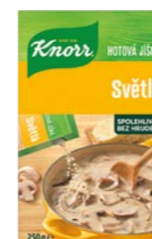
Hotová jíška světlá 0,25 kg