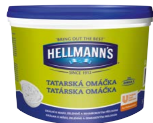
Tatarská omáčka 5 l

Oblíbená tatarská omáčka, na jejíž kvalitu a poctivou chuť se můžete vy i vaši zákazníci spolehnout. Vybírat můžete z velkých i praktických jednorporcových balení.