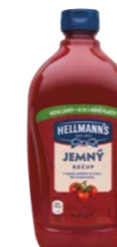
Kečup jemný 840 g