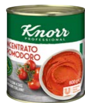
Rajčatový protlak 0,8 kg