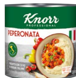
Peperonata 2,6 kg