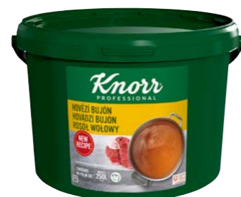
Hovězí bujón 5 kg