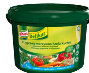
Delikat 5 kg