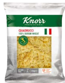
Quadrucci – Fleky 3 kg

Přímo ze slunné Itálie pro vás dovážíme kvalitní semolinové těstoviny, které neobsahují přidaná vejce. Vyberte si z široké nabídky tvarů a velikostí pro každou příležitost.