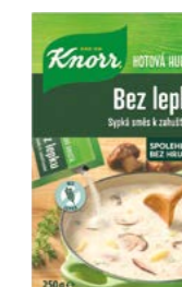
Huštěná směs k zahuštění bez lepku 0,25 kg