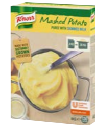
Bramborová kaše s mlékem 4 kg Počet porcí: 130

Jemná bramborová chuť a perfektní konzistence, jako byste přílohu připravovali od základu. Nabídněte hostům pestrou nabídku bramborových příloh.