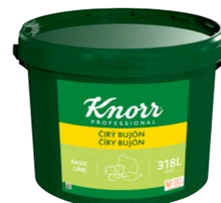
Čirý bujón 7 kg

Skvělý univerzální bujón obohacený sekanou petrželkou a dalšími bylinkami. Vhodný do krémových polévek, omáček, šťáv a dalších pokrmů nebo na ochucení vody pro vaření vloček a zavářek.