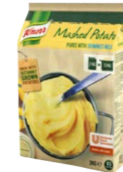
Bramborová kaše s mlékem 4 x 2 kg Počet porcí: 262