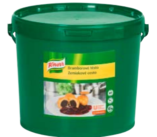
Bramborové těsto 10 kg Počet porcí: 117