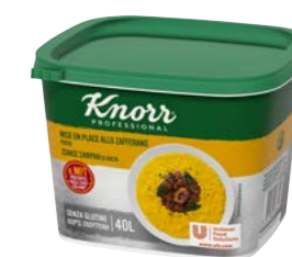
Šafránová pasta 800 g