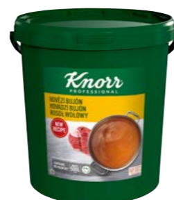
Hovězí bujón 10 kg