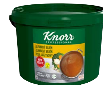
Zeleninový bujón 5 kg