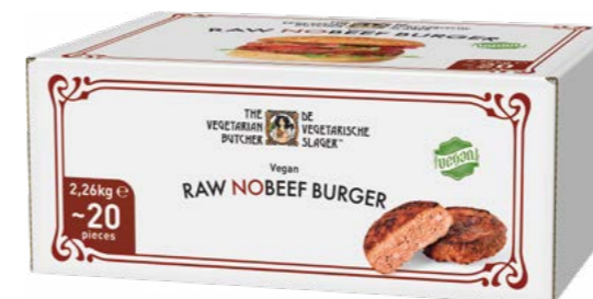
Raw NoBeef Burger 2,26 kg (20 x 113 g)