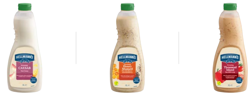
Caesar 1l Med a hořčice 1l Tisíc ostrovů 1l