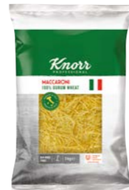
Vlasové nudle 3 kg