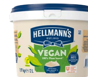
Vegan 2 l