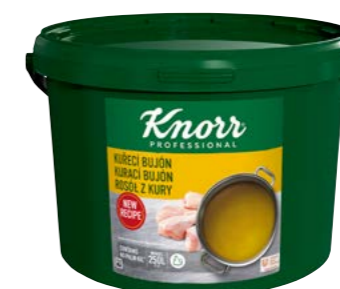
Kuřecí bujón 5 kg Počet porcí: 1 000