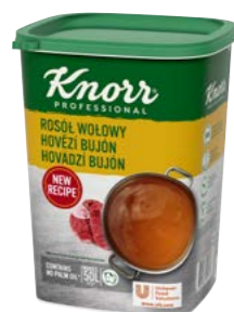
Hovězí bujón 1 kg

Čiré bujóny se silnou chutí a vůní vývaru z hovězího masa se hodí k posílení hovězí chuti u celé řady pokrmů: od polévek, omáček, šťáv a marinád až třeba po koprovou omáčku. Bujóny jsou bez alergenů (bez lepku a laktózy) a bez palmového oleje.