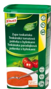
Toskánská tomatová polévka s bylinkami 1,2 kg