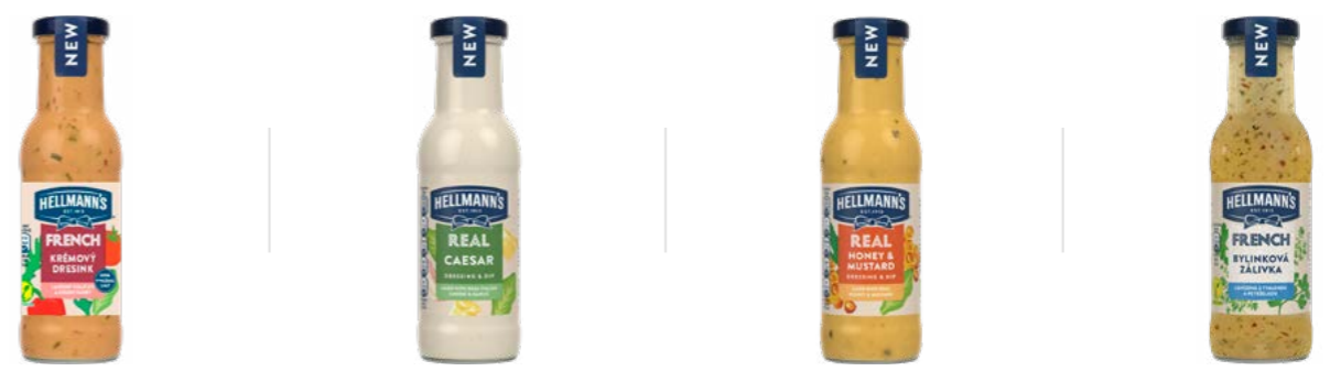
Francouzský 250 ml Caesar 250 ml Medovohořčicový 250 ml Bylinková zálivka 250 ml

Obohatit nabídku salátů může být tak snadné, když můžete vybírat z široké řady dresinků Hellmann's. Jsou vždy stejně dobré a navíc kdykoli po ruce.