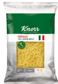
Farfalle 3 kg