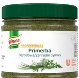
PRIMERBA Zahradní bylinky 340 g