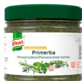
PRIMERBA Provensálské bylinky 340 g