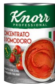
Rajčatový protlak 4,5 kg

Špičková kvalita dostupná po celý rok, to jsou zeleninové směsi z vysoce kvalitní zeleniny dovezené přímo z Itálie. Speciálně ochucené směsi Knorr splňují ty nejvyšší nároky.