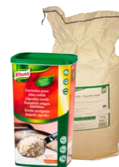
Světlá jíška 1 kg/10 kg

Díky své granulové konzistenci se okamžitě rozpouštějí a netvoří hrudky, takže jimi můžete pokrm zahustit kdykoli během vaření. Zkrátka rychlý a spolehlivý pomocník pro všechny případy.