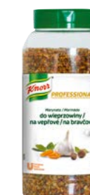
Sypký kořenící přípravek na vepřové 0,75 kg