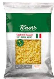
Cresti di gallo 3 kg