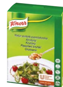
Krutony 700 g