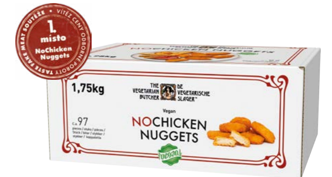
NoChicken Nuggets 1,75 kg (87 x 18 g)