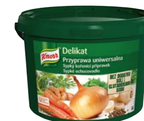
Delikat bez přídavku soli 3 kg