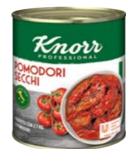
Sušená rajčata v oleji 0,75 kg