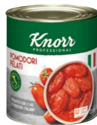
Pomodori Pelati celá loupaná rajčata 2,5 kg