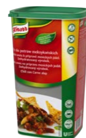
Fix pro mexická jídla 1,2 kg

Jak jednoduše dosáhnout vynikající chuti, ať už se pustíte do klasiky nebo mezinárodní kuchyně? Uspadněte si práci s kvalitními základy Knorr. Vhodné i na zapékání.