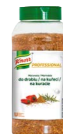
Sypký kořenící přípravek na kuřecí 0,7 kg