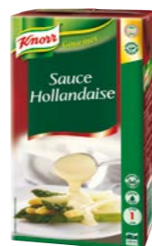
Holandská omáčka tekutá 1 l