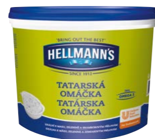
Tatarská omáčka 10 l