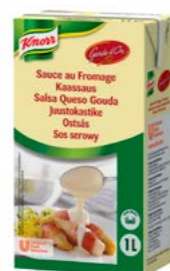
Garde d'Or Sýrová omáčka 1 kg