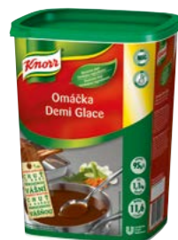
Demi Glace 1,1 kg

Minutkové omáčky Knorr jsou skvělým řešením pro vaše menu. Vždy stejně kvalitní, se správnou konzistencí a perfektní chutí i vůní. Pro všechny moderní a kreativní kuchaře.