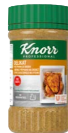
Delikat Koření na drůbež 600 g

Kořenící přípravky Knorr se vám budou hodit jak pro teplou, tak i pro studenou kuchyni. Originálně kombinují chuť a vůni vybraných bylinek, zeleniny a koření.