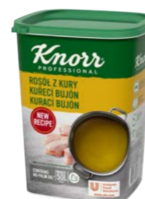
Kuřecí bujón 1 kg Počet porcí: 200

Číré zlatavé bujóny s typickou chutí a vůní kuřecího vývaru. Vhodné do polévek, omáček, šťáv, marinád, na dochucení zeleninových i drůbežích pokrmů. Bujóny jsou bez alergenů (bez lepku a laktózy) a bez palmového oleje.