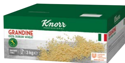
Grandine – Tarhoňa 3 kg