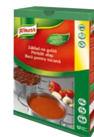
Základ na guláš 1,1 kg