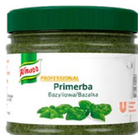
PRIMERBA Bazalka 340 g

Vysoce kvalitní pasty z voňavých bylinek, hub a zeleniny, které byly šetrně zpracovány ihned po sklizni, bez konzervantů a přidaných barviv. Ideální pro přípravu studených i teplých pokrmů.