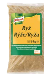
Rýže dlouhozrnná parboiled 5 kg Počet porcí: 71

S dlouhozrnnou rýží parboiled dosáhnete vždy stejně dobré a syké konzistence. Klasická příloha k masům i jako základ dalších rýžových variací.