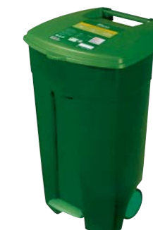
Čirý bujón 60 kg