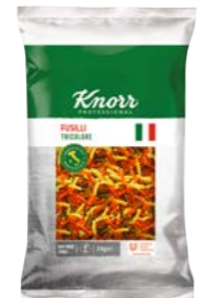
Fusilli Tricolore 3 kg