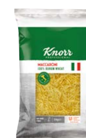
Polévkové nudle 3 kg