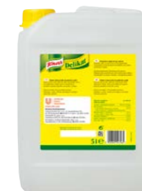
Delikat tekutý 5 l