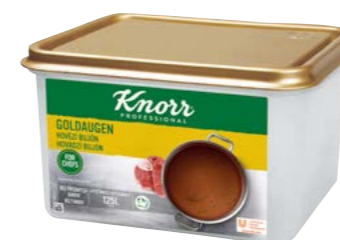
Goldaugen – Hovězí bujón 3 kg Počet porcí: 500

Goldaugen (známá receptura „se zlatými očky“) je zárukou bujónu se silnou vůní a chutí vývaru z hovězího masa. Ideální k zesílení hovězí chuti polévek, omáček, šťáv či pokrmů s hovězím masem.