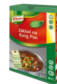
Základ na Kung Pao 1,5 kg