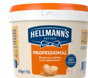
Professional majonéza 5 l