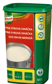
Jemná sýrová omáčka 1,2 kg