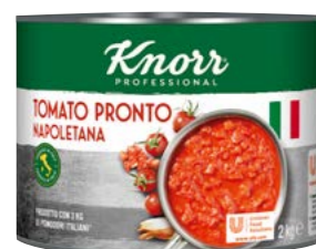
Tomato Pronto 2 kg