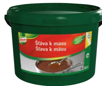
Šťáva k masu 3,5 kg Vydatnost: 35 l

Jsou použitelné bez vlastní úpravy nebo jako základ nejrůznějších variací šťáv a oceníte je zejména při přípravě masa v konvektomu. Knorr Šťávy zkrátka mají šťávu!