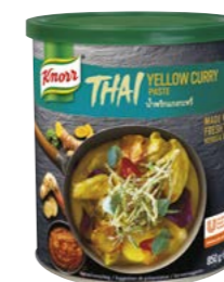
Žlutá kari pasta 850 g

Nepostradatelným pomocníkem pro přípravu všech kari pokrmů je žlutá kari pasta naší thajské kolekce. Autentická chuť je zaručena – naše kari pasta byla vyrobena přímo v Thajsku.